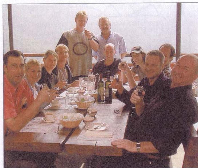
Das Egger OK und lokale Vertreter stossen auf die gute Zusammenarbeit an.